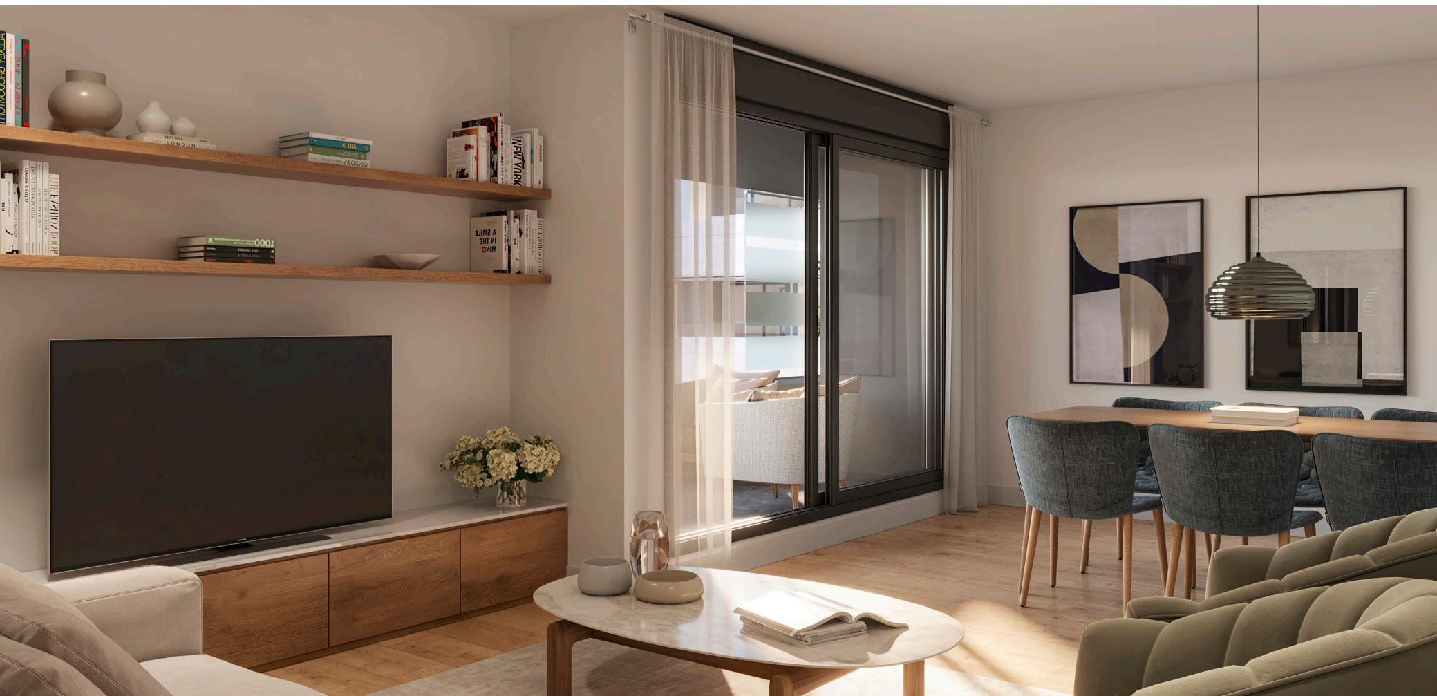
Interior de la vivienda. Acabados